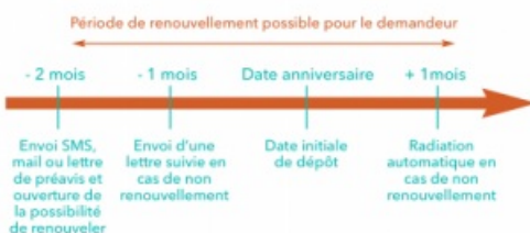
Schéma du renouvellement annuel

ATTENTION les informations (adresse, téléphone, mail, situation familiale ou professionnelle, ressources) contenues dans votre dossier doivent être régulièrement actualisées afin de garantir le suivi de votre demande et en vue de recevoir toute information.