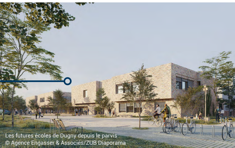
Les futures écoles de Dugny depuis le parvis

Le Village des médias accueillera une nouvelle école à Dugny. Construite avec des briques issues du réemploi, cette école primaire de 16 classes sera au coeur du nouveau quartier et des espaces verts environnants.